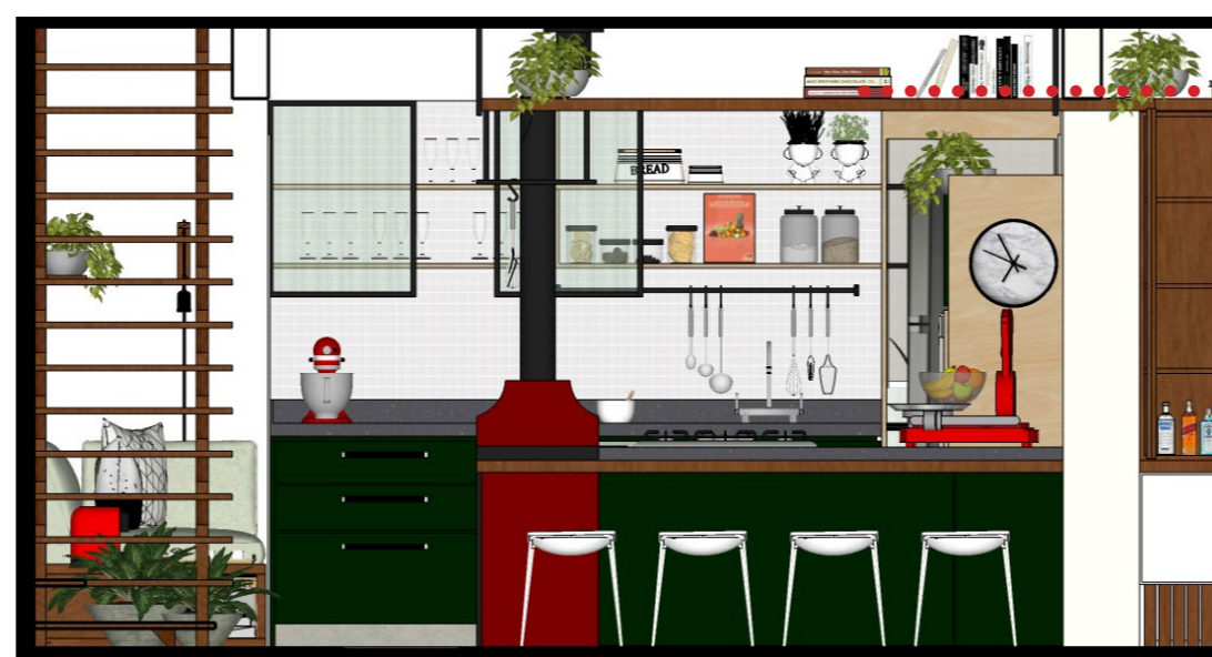
VISTA FRONTAL SEM ESCALA