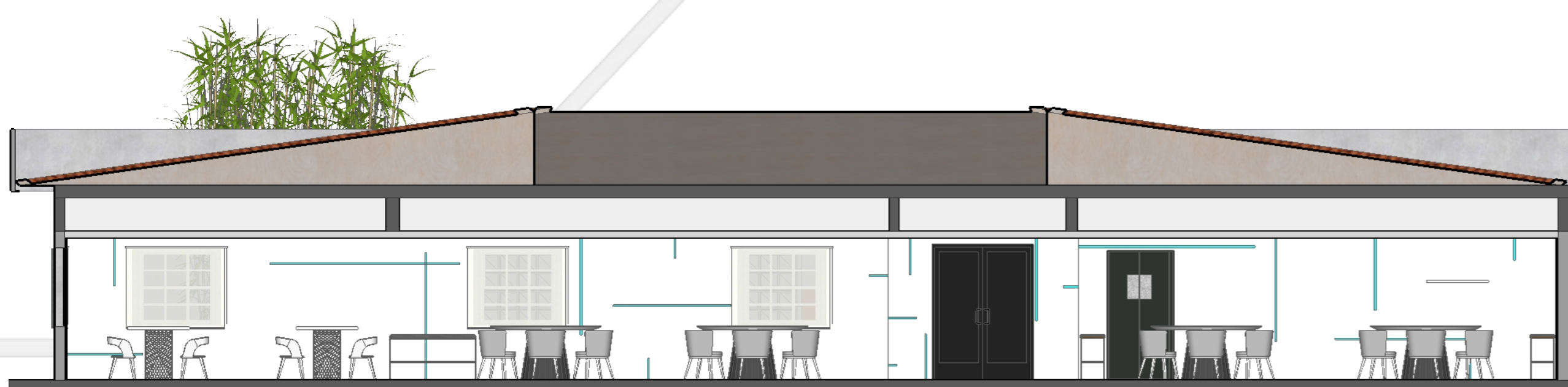
• CORTE LONGITUDINAL

Desta forma, este conjunto torna-se o protagonista do projeto, permitindo que todo o restante seja tratado de forma minimalista e pura. A ausência de cores nos painéis (que revestem todas as paredes e pilares) e no mobiliário solto concede licença para que o ambiente transforme-se indefinidamente. Complementando as inovações, as mesas redondas maiores receberam projeções nos tampo para que mídias interajam com os usuários e mobiliário. Assim, um dia o ambiente pode ter temática de fogo e no outro de água, conforme os efeitos criados no dia das fotos. As possibilidades são infinitas. A ideia é gerar uma experiência única a cada dia para os clientes, que os motive a voltar sempre em busca do inusitado.